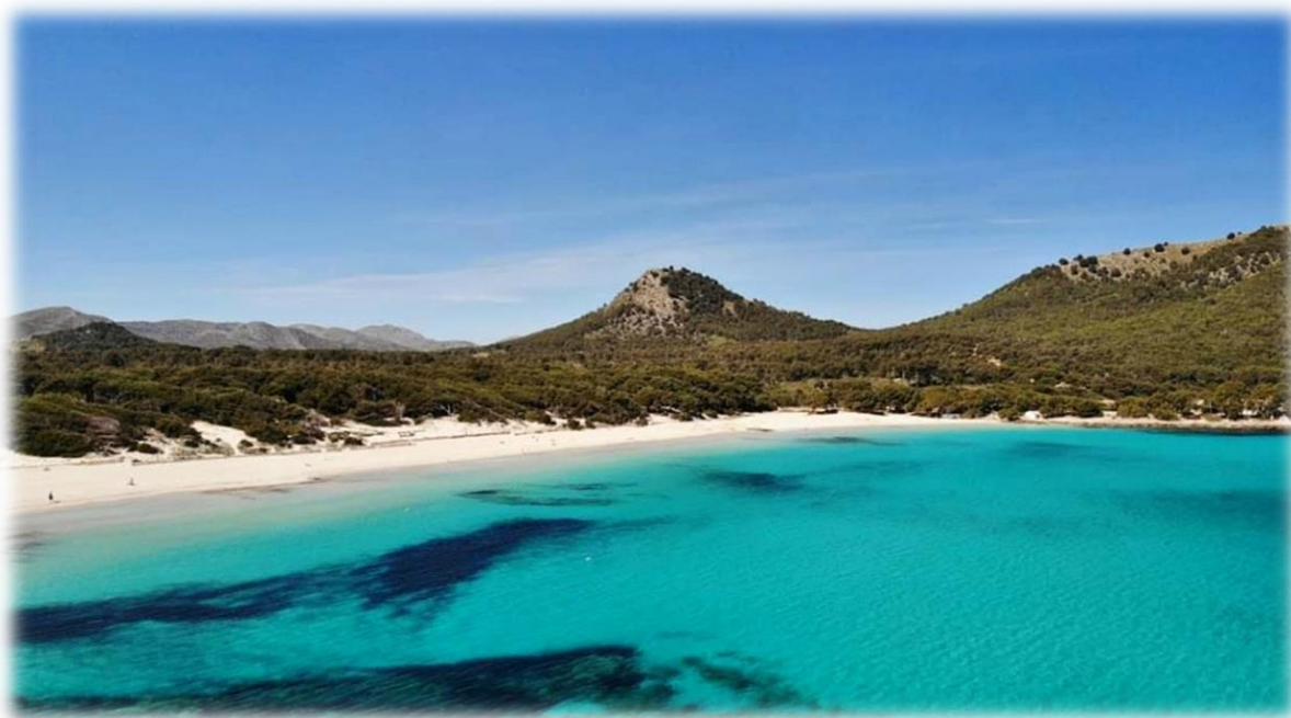
Cala Agulla, Cala Ratjada

Cala Ratjada je turistické středisko ležící v nejvzdálenější severovýchodní části ostrova Mallorca. Táhne se po obou stranách poloostrova Punta de Capdepera a její pláže omývá azurová voda Středozevního moře. Centrum tvoří historické jádro s místním kostelem a starobylý rybářský přístav s neopakovatelným kouzlem, odkud odplouvají lodě na sousední ostrov Menorca. Je zde spousta restaurací, kaváren, občůdků. Úzké klikaté uličky kontrastují s novými moderně vybavenými hotely. V letovisku se nachází několik písčných pláží, které jsou dosažitelné městskou dopravou - autobus, motorový vláček.