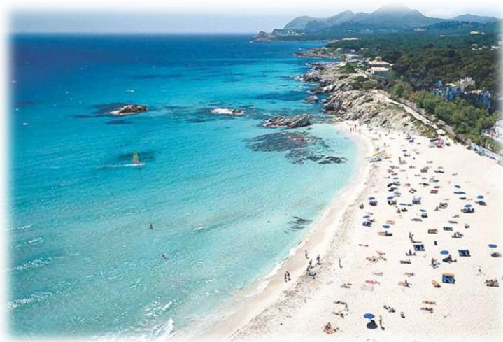
Son Moll, Cala Ratjada

Cesta z letiště v Palma de Mallorca trvá cca 60 minut.